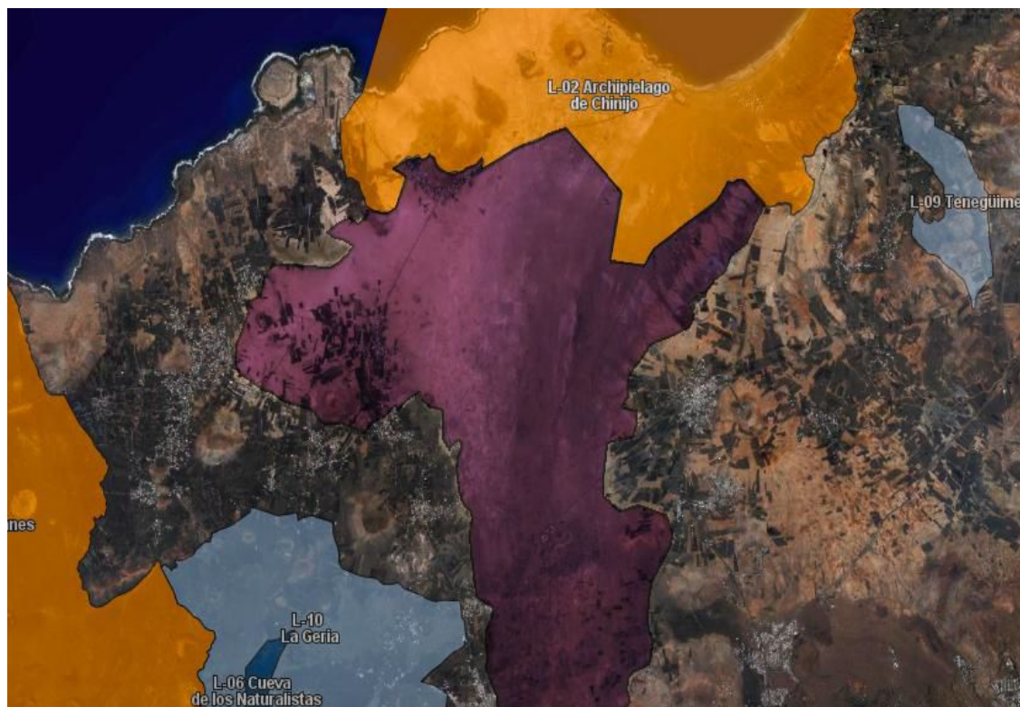
Fig. 1: Propuesta de zona de protección por el Parque Rural El Jable, que continuaría la zona protegida del Archipiélago Chinijo.

Actualmente, parte de la zona de El Jable, se encuentra protegida por otras figuras de protección como la zona ZEPA y el Parque Natural del Archipiélago Chinijo, pero gran parte de este recurso natural solo cuenta con la consideración de suelo rústico de protección ecológica que le otorgó el PIOT hace ya 30 años.