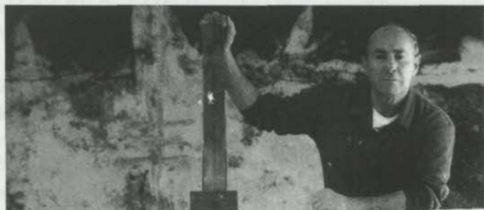
César Manrique en su estudio