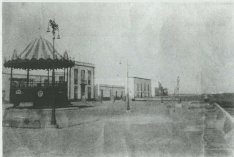
Quiosco de la música

lución ha sido la de la propia ciudad, del comportamiento y sentir de sus habitantes.