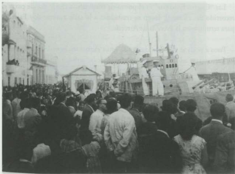
Una vieja imagen del carnaval de Arrecife

Hay que enmarcar la fiesta en el contexto de una sociedad sometida a constantes miserias y hambrunas que atizan a la población. A pesar de la dureza de la vida cotidiana, la gente se vuelca en la fiesta.